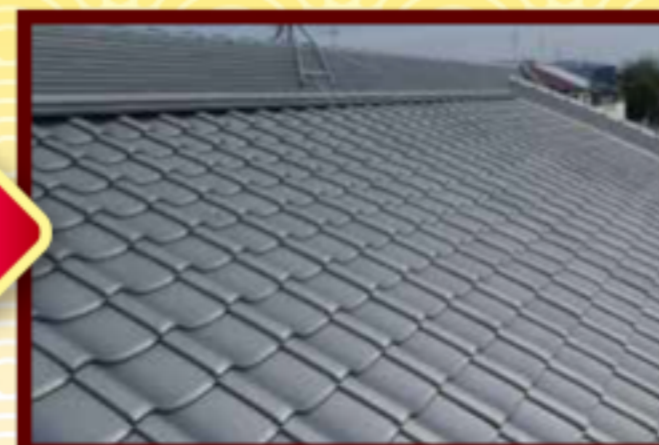
軽量化と耐震性を向上させた屋根で安心して過ごしていただけます。

現在の瓦屋根は 軽量化 と 耐震性 を向上させた工法で施工致します。瓦独自の 断熱 、 通気 、 遮音 等のメリットはそのまま、災害等への安心も兼ね合わせています。