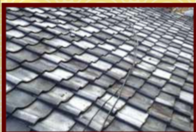
ズレや傷みの出た瓦屋根。