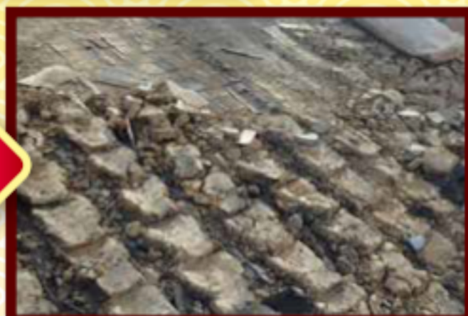
【葺き土の撤去】以前の屋根は大量の土で瓦を固定したため重量があります。